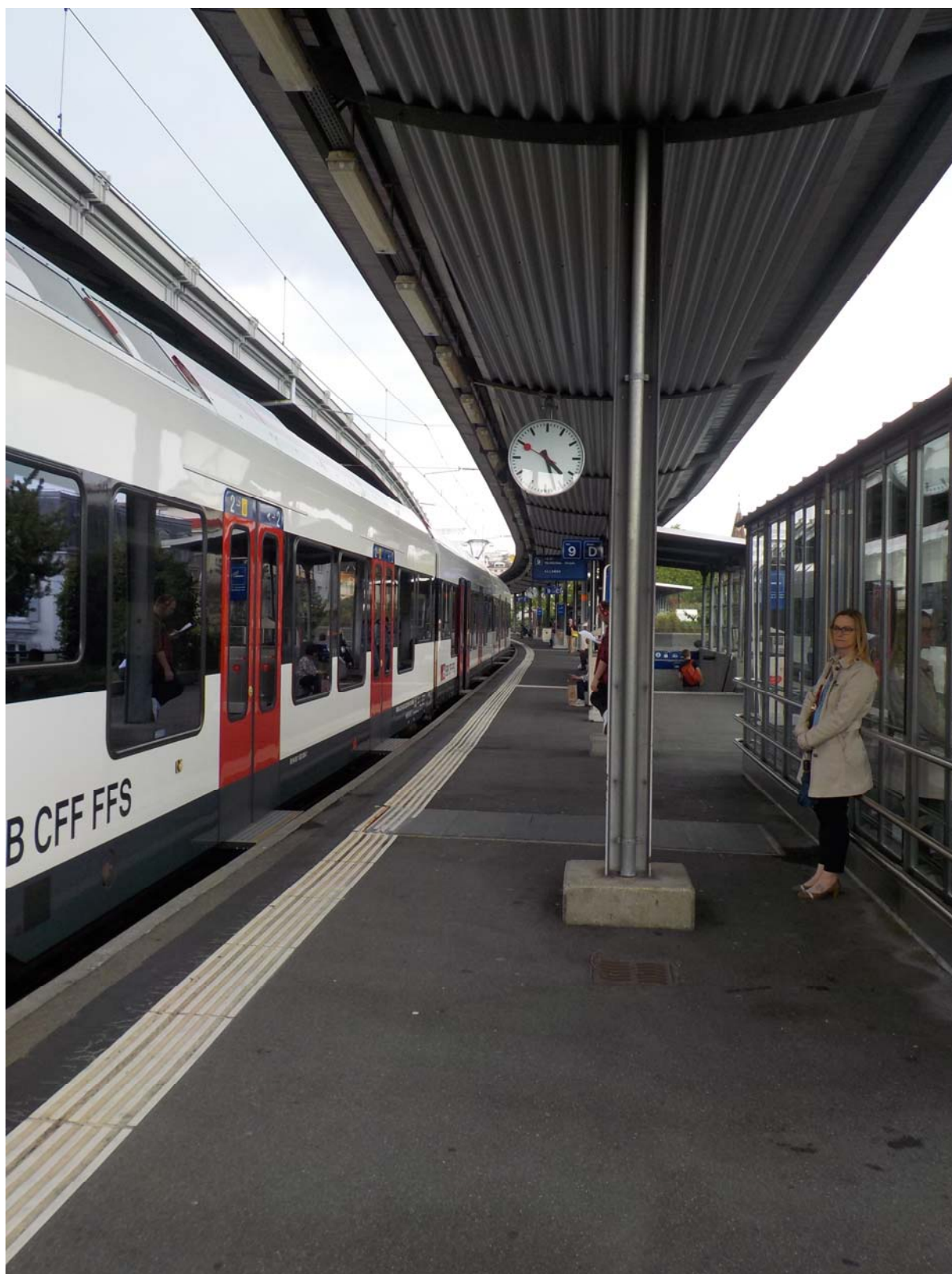
Gare de Lausanne, juin 2018.